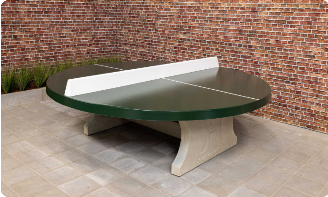
Table de ping-pong verte ronde