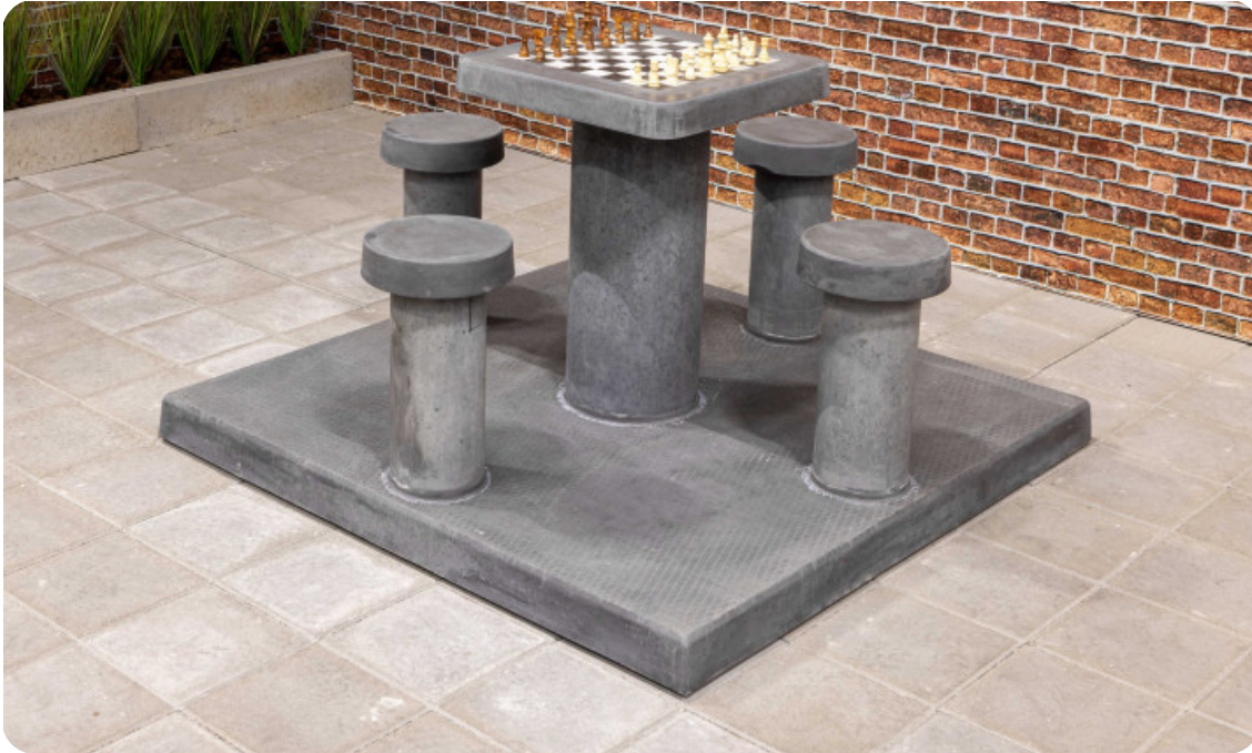
Table d'échecs en béton anthracite, 4 personnes