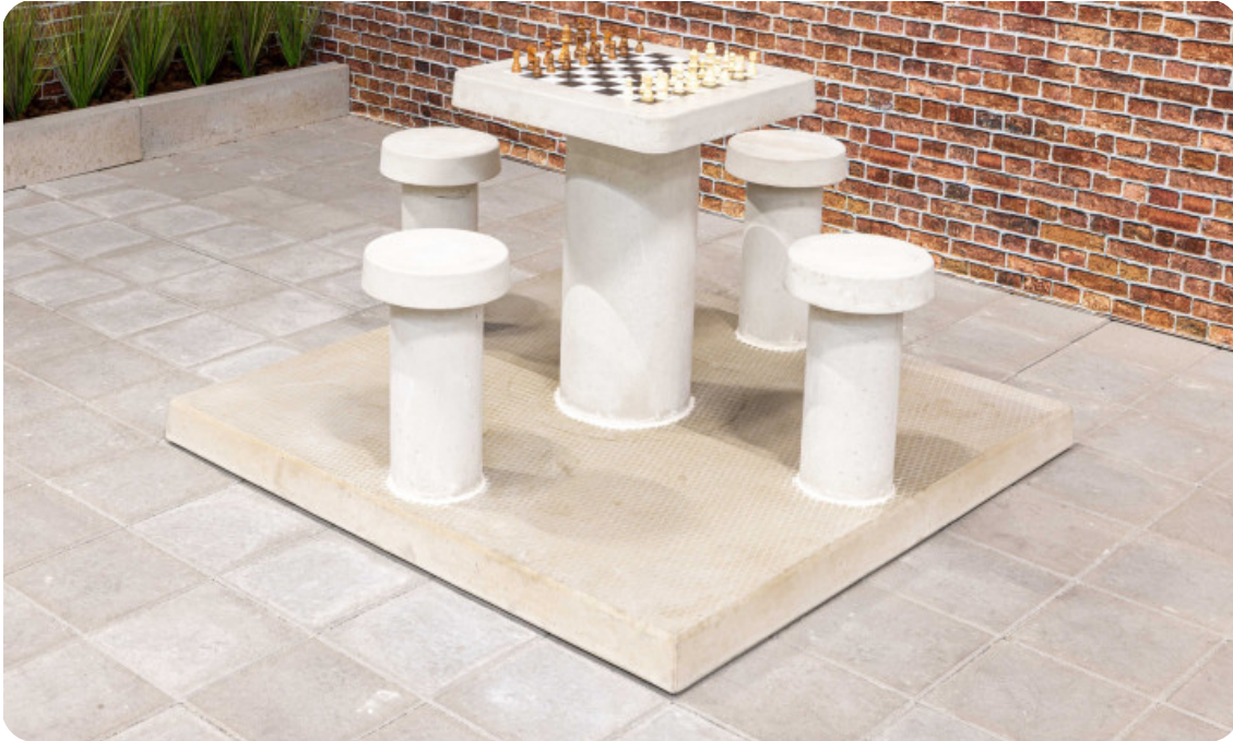
Table d'échecs en béton naturel, 4 personnes